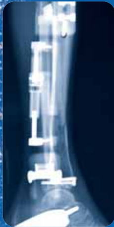
XCaliber per Caviglia