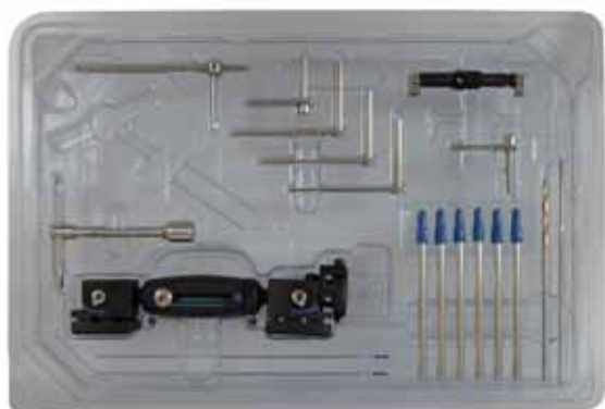
99-91600UE Kit XCaliber Meta-diafisario con Strumentario, sterile