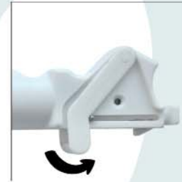
LEVA DI CARICAMENTO TRIGGERING LEVER