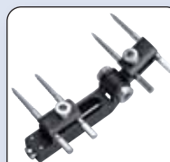
MINIFISSATORI A SLITTA