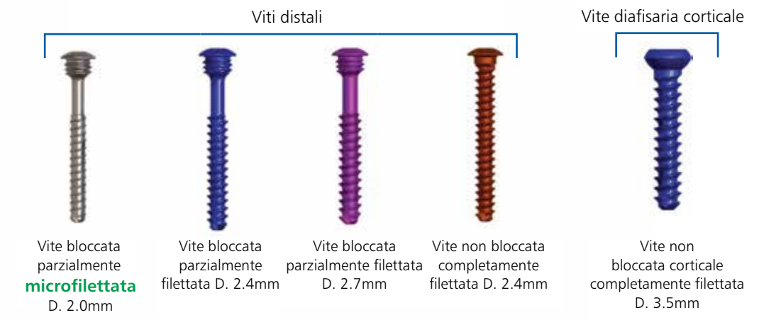
Vite bloccata parzialmente filettata D. 2.0mm Vite bloccata parzialmente filettata D. 2.4mm Vite bloccata parzialmente filettata D. 2.7mm Vite non bloccata completamente filettata D. 2.4mm Vite non bloccata corticalmente completamente filettata D. 3.5mm