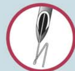
Repere con punta a "Z"