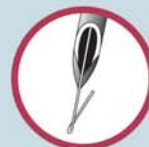
Repere con punta a uncino