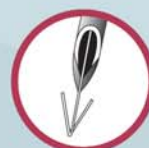
Repere con doppio uncino